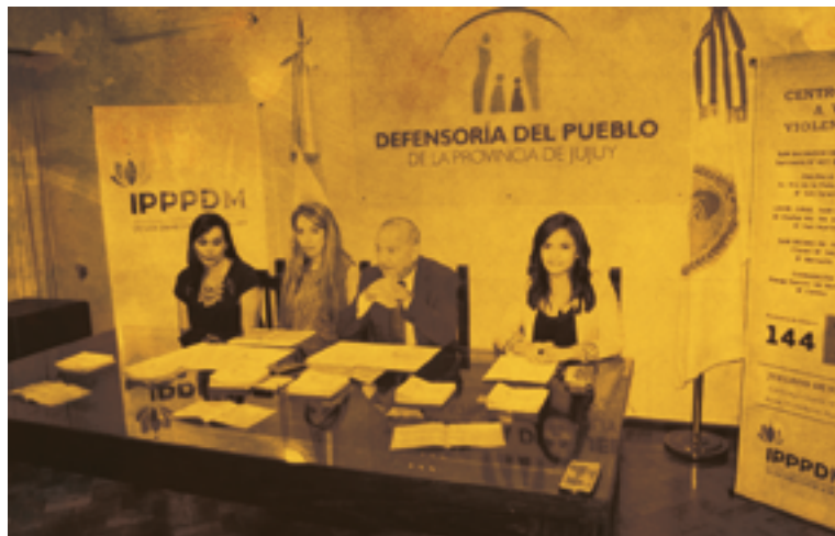
Presentación del Instituto de Prevención, Promoción y Protección de los Derechos de la Mujer en la Defensoría del Pueblo de la Provincia de Jujuy