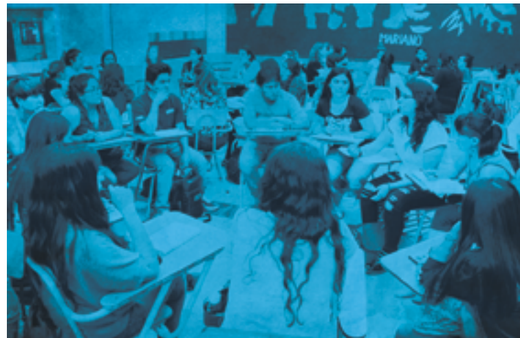
Alumnxs exponiendo sus trabajos.

El grupo es un gran sostén y el espacio que allí se genera tiene también el objetivo de elaborar las ansiedades, los miedos y todo lo que se moviliza en las clases teóricas en donde se desarrollan temas de fuerte impacto. Este dispositivo ha permitido que podamos acompañar diversos procesos, algunos muy difíciles, promoviendo la sanación de heridas a través de la circulación de la palabra y la construcción de un tejido vincular.