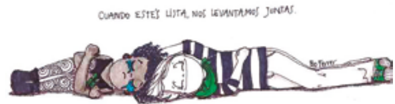
Ilustración de Ro Ferrer ilustradora argentina.

“La Diplomatura es para mí lo que expresa esta imagen: