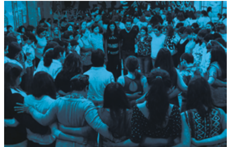
Experiencia de Biodanza en la Diplomatura

dinamizar procesos estabilizados. Cuando nos percibimos escindidos por mandatos, estereotipos, prejuicios, disociaciones u otras dificultades personales, que obstaculizan la evolución y el bienestar personal.