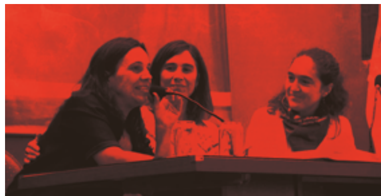
De izquierda a derecha:

En el actual contexto donde las brechas aún no se cierran, las desigualdades persisten y la violencia parece no tener techo, la continuidad de la Diplomatura en Violencia de género Derechos y Movimiento de Mujeres se configura como una necesidad de las mujeres y del movimiento que lucha por sus derechos, como una herramienta concreta de transformación social, y desde ahí el compromiso colectivo de seguir sosteniéndola.