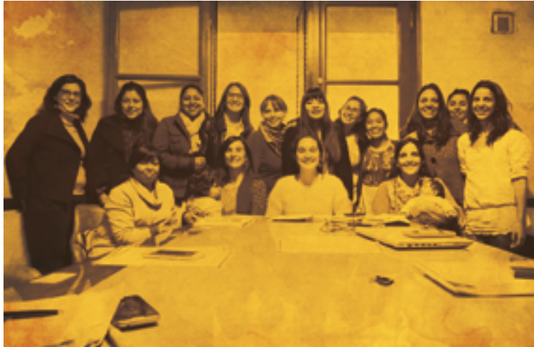
Primer equipo de la Diplomatura Cohorte 2017