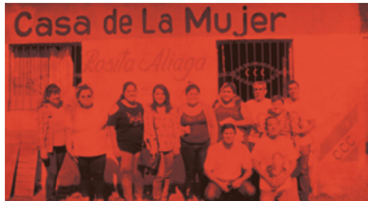
Casa de la Mujer Rosita Aliaga

“Porque yo había tenido una experiencia conociendo el Encuentro Nacional de Mujeres y luego intentando unirme a agrupaciones de mujeres para luchar por nuestros derechos, pero algo más faltaba para hacer lo que yo quería hacer que era poder ayudar a otras mujeres que sufrían violencia de género. Me faltaba la formación y el aprendizaje para no cometer errores y poder brindar lo mejor de mí a todas ellas; y de pronto apareció la Diplomatura en donde me ofrecían diversas temáticas que tienen que ver con lo que vivimos a diario las mujeres, pero tenemos tan naturalizada y fue lo que me completó”.