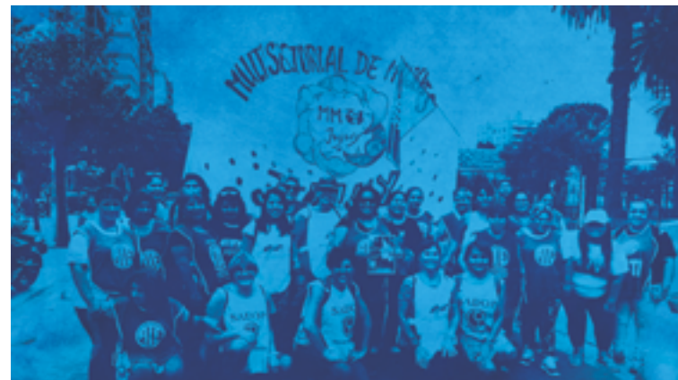
Las áreas de género de los gremios participando de la movilización del 8 de marzo del 2020 en Jujuy

Es decir, que trabajadores y trabajadoras podamos asumir la convicción de que la lucha contra la discriminación y la violencia, nos debe convocar a todos y todas, no solamente a las trabajadoras y que incluirlo en la agenda sindical significa un compromiso con el derecho a la igualdad y con la construcción de una sociedad más justa.