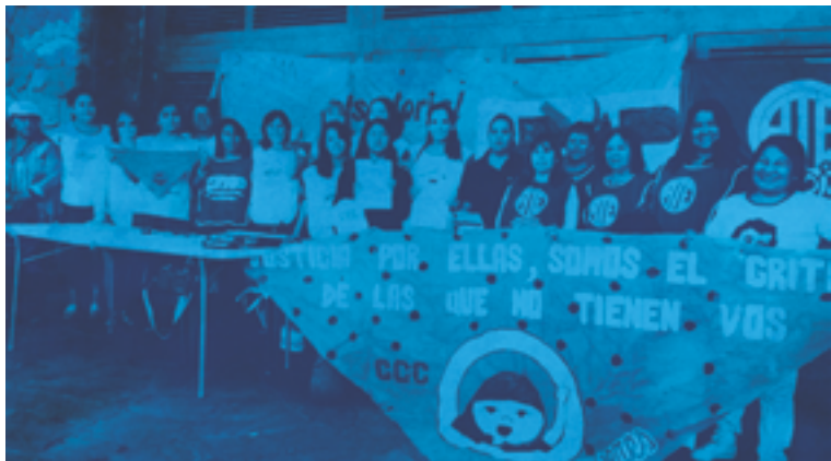
Compañeras de diferentes gremios presentando un proyecto conjunto en la Legislatura Marzo del 2020