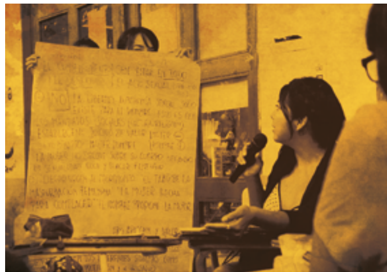
Alumnxs en reunión de grupo luego de finalizar el módulo