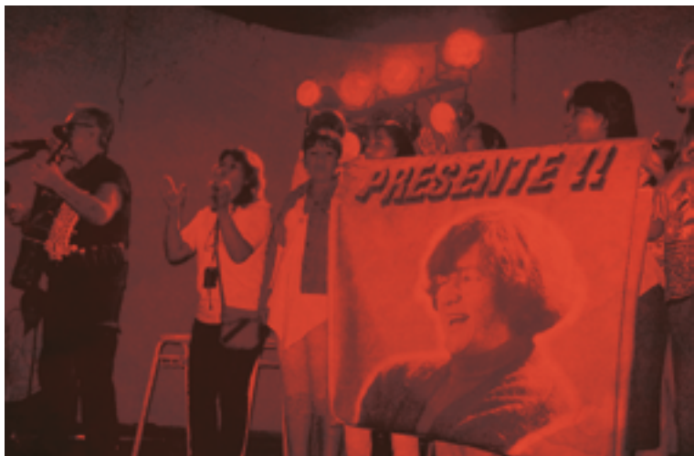
Festival de León Gieco en San Pedro de Jujuy

junto a las mujeres de la Casa María Conti