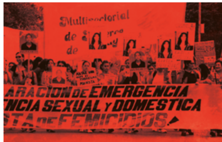
Una de las tantas movilizaciones

Este libro intenta reflejar cómo llegamos a esta Diplomatura, como la transitamos, crecimos y nos fortalecimos para dar nuevas batallas y también pretende aportar a los debates que consideramos esenciales en la realidad actual.