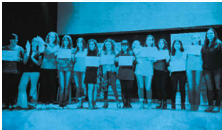
Equipo de tutoras recibiendo su distinción en el cierre de la segunda cohorte

Podemos decir que las mujeres que impulsamos y sostuvimos esta experiencia de formación, al igual que lxs alumnxs que han sido parte de la Diplomatura estos años, no somos las mismas. Hemos registrado procesos de aprendizaje propios, que lograron movilizar nuestras experiencias, pensamientos y sentimientos que no sólo provocaron grandes emociones desde un primer momento, sino que también transformaron nuestras propias subjetividades.